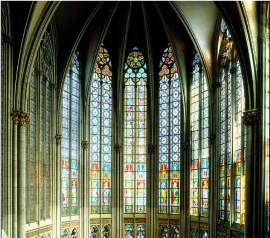
Köln, Dom, Chor, Obergaden