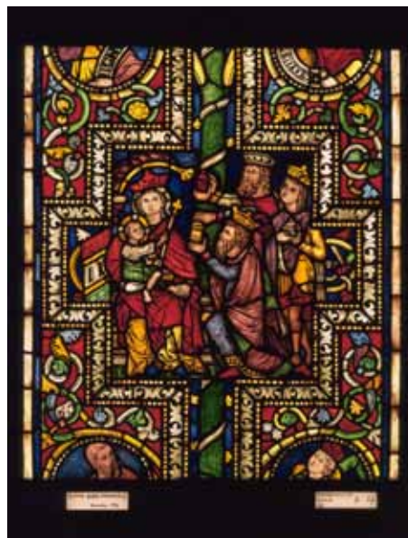
Köln, Dom, Chor, Ältere Bibelfenster, Detail: Anbetung der Heiligen Drei Könige

Die letzte Station führt zum neuesten Fenster