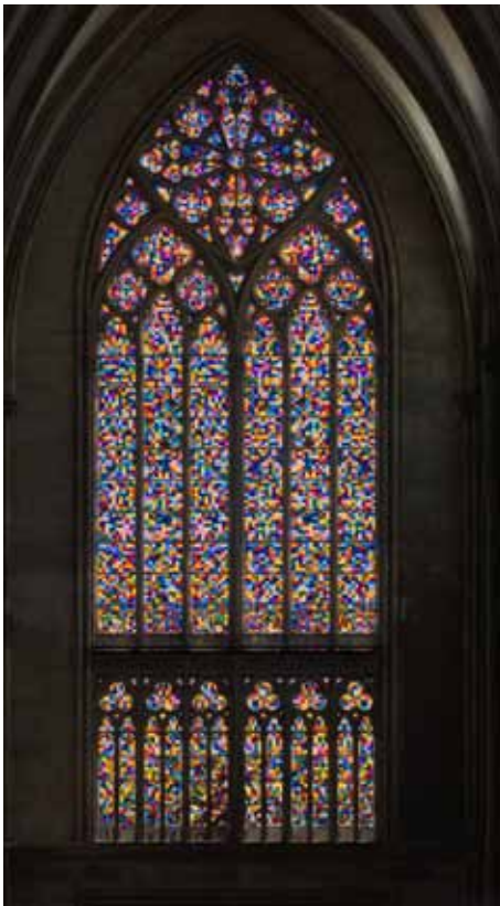
Köln, Dom, Südquerhausfenster nach einem Entwurf von Gerhard Richter © Entwurf: Gerhard Richter, Köln