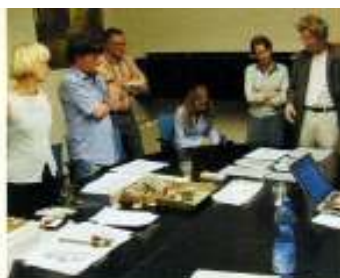
Anlässlich der Abitare il Tempo trafen sich die Innen-/Architekten zum Workshop in Verona.