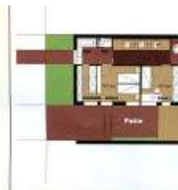
EG-Grundriss und Perspektive von artis Entwurf: Sigrun Musa, Frankfurt/Main